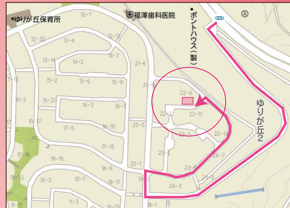
◎カーナビ設定は、名取市ゆりが丘2丁目22-8です