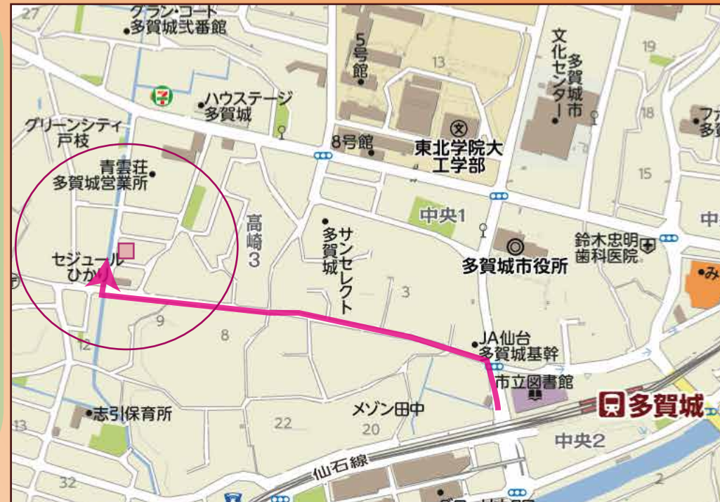
◎カーナビ設定は、多賀城市高崎3丁目 27-21 です

安心・快適な オール電化住宅！ 収納に便利な ウォークインクローゼット付！ 全居室6帖以上！ ホールは多目的に 利用可能です！