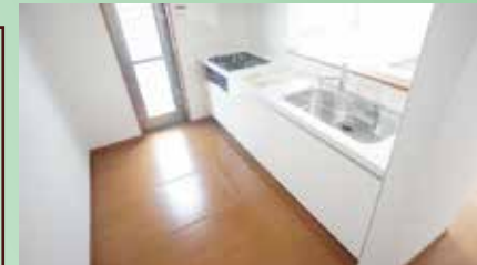
キッチン同仕様例

お支払例 頭金なし・ボーナス払なし 月々 70,800 円 東邦銀行・借入2,680万円・変動金利・期間35年 0.6%のシミュレーションでございます。 金融情勢により、金利等の変更がある場合がございます。