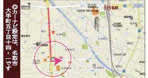
◎カーナビ設定は、名取市大手町五丁目十四-1です

物件概要 ■所在地：名取市大手町5丁目14-1 ■土地権利：所有権 ■交通：JR東北本線「名取」駅 徒歩11分 ■地目：宅地 ■構造：木造2階建て ■土地面積：131.33㎡ ■建物面積：102.67㎡ ■建築確認番号：第H29確認建築宮城建住00342号 ■都市計画：市街化区域 ■用途地域：1種住居 ■建ぺい率：60% ■容積率：200% ■設備：東北電力・公営水道・本下水・都市ガス ■完成予定：平成29年8月 ■現況：建築中 ■引渡予定：平成29年8月 ■接道状況：北側5.9m公道 ■学区：増田西小学校・第二中学校