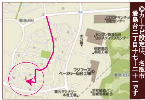
◎カーナビ設定は、名取市愛島台二丁目十七-二十一です

物件概要 ■所在地：名取市愛島台2丁目17-21他 ■土地権利：所有権 ■交通：なとり号「グリーンポート愛島」停 徒歩7分 ■土地面積：257.84㎡ ■建物面積：105.99㎡ ■地目：宅地 ■建築確認番号：第H28確認建築宮城建住06128号 ■構造：木造2階建て ■都市計画：市街化区域 ■用途地域：1種低層 ■建ぺい率：40% ■容積率：60% ■設備：東北電力・公共上下水・集中LPガス ■築年月：平成29年7月 ■現況：完成済 ■引渡：相談 ■接道状況：南西側6m公道 ■学区：愛島小学校・第一中学校