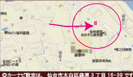
◎カーナビ設定は、仙台市太白区袋原3丁目16-39です

物件概要 ■所在地：仙台市太白区袋原3丁目16-39 ■土地権利：所有権 ■交通：市営バス「袋原中学校」停 徒歩2分 ■構造：木造2階建て ■土地面積：169.13㎡ ■建物面積：105.98㎡ ■地目：宅地 ■建築確認番号：第H28確認建築宮城建住05106号 ■都市計画：市街化区域 ■用途地域：1種低層 ■建ぺい率：50% ■容積率：80% ■設備：東北電力・公営水道・本下水・都市ガス ■築年月：平成29年5月 ■現況：完成済 ■引渡：相談 ■接道状況：南側約9.9m公道 ■学区：袋原小学校・袋原中学校