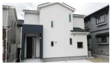
◎カーナビ設定は、仙台市太白区東大野田9-33付近です