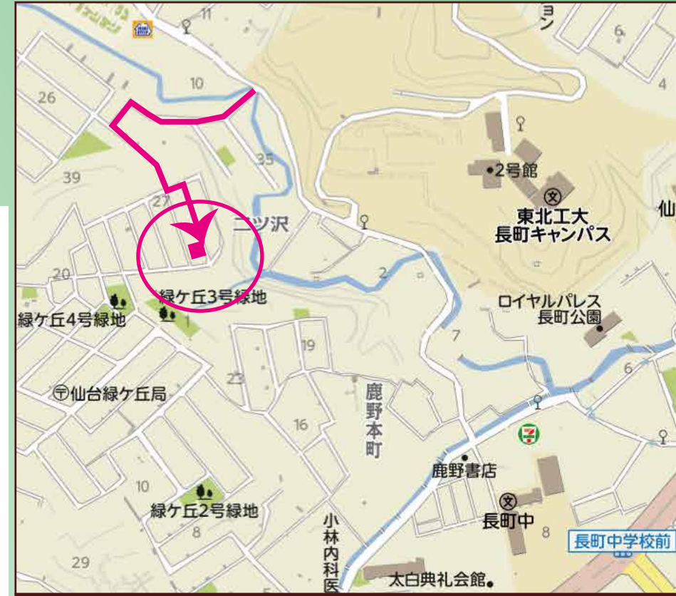
◎カーナビ設定は、仙台市太白区緑ヶ丘3丁目28-21です