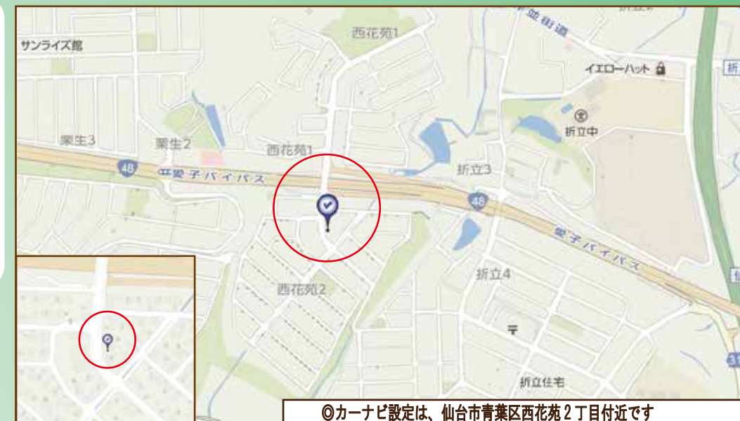
◎カーナビ設定は、仙台市青葉区西花苑2丁目付近です